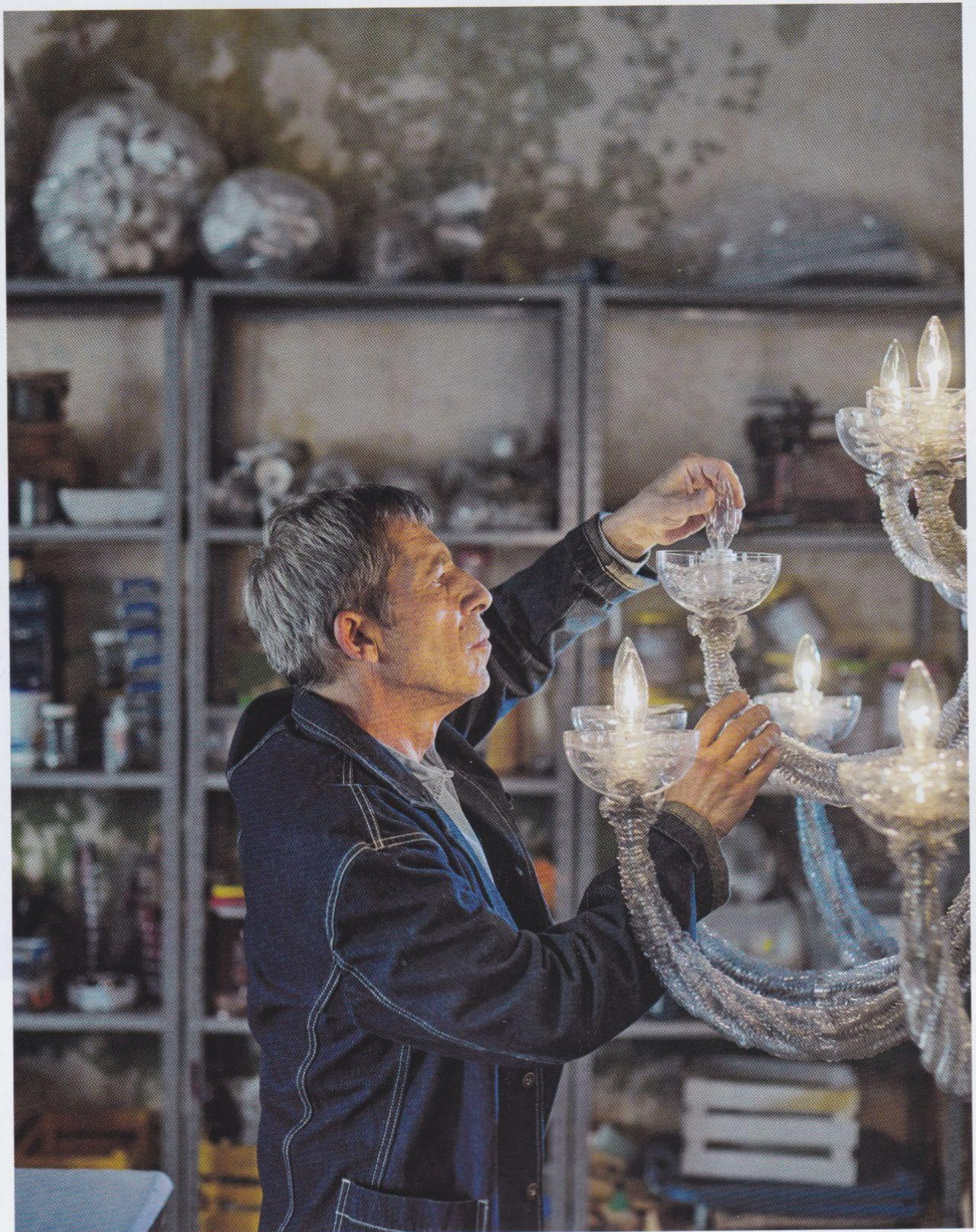
Sus diseños han llegado a galerías y hogares del mundo entero, uno de sus últimos logros fue formar parte de un proyecto de interiorismo del gran Ken Fulk.