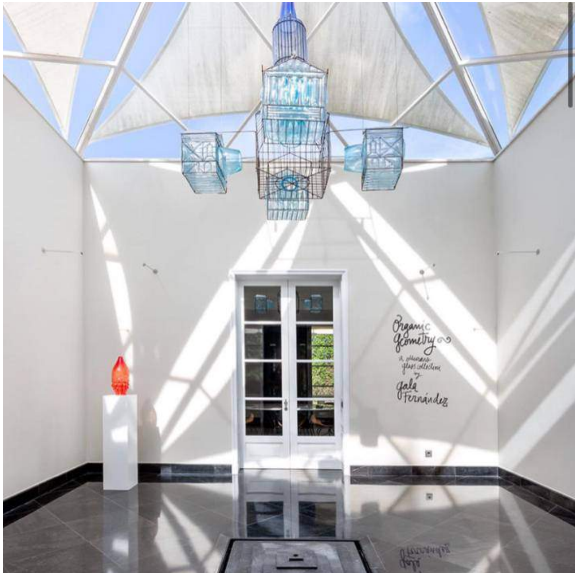
'Organic Geometric', en la galería Isolina Arbulu, en Marbella.